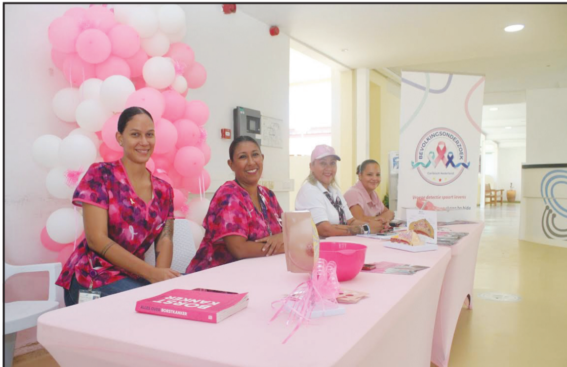
Riba potrèt: Potrèt tim di Skrinen di poblashon Hulanda Karibense

No duda i tuma kontakto ku nos via telefòn òf whatsapp (+599) 7810476 òf via mail screeningCN@rivm.nl